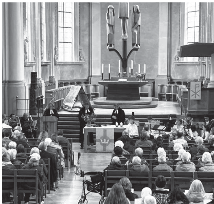
Foto: Predigt zu dritt am Himmelfahrtstag