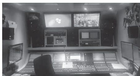
BR-Übertragungsbus. Foto: Jürgen Dolling Foto Mitwirkende: Monatsgruß S. 18.

Beim Festgottesdienst am Reformationstag gelang ein schönes, gemeinsames Feiern mit prägnanten Worten und eindrücklicher Musik. Etliche Rückmeldungen haben wir nach der Übertragung im Bayerischen Rundfunk und im Deutschlandfunk erhalten. Der Gottesdienst lässt sich nachträglich noch anhören: www.wuerzburg-ststephan.de .