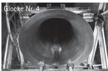
Glocke Nr. 4

Für Barspenden liegen am Kircheneingang Umschläge, die man in den Klingelbeutel stecken oder im Pfarramt abgeben kann. Die Kontonummer lautet: